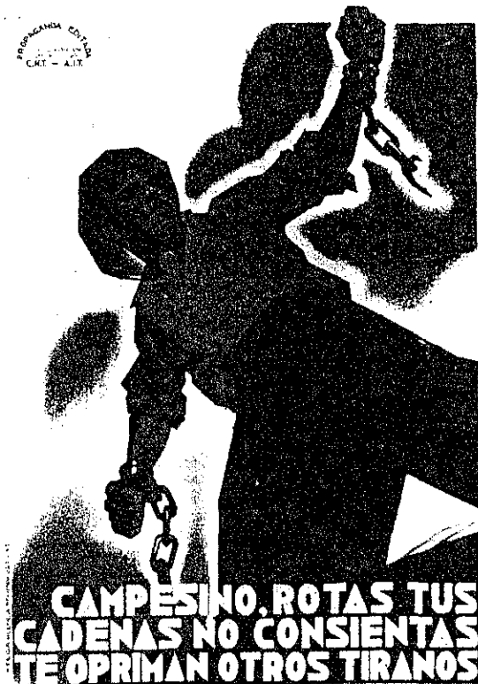
Cartell d'Artur Balléster editat per la CNT-FAI

ESTUDIS D'HISTÒRIA AGRÀRIA, núm. 13, Barcelona, 2000.